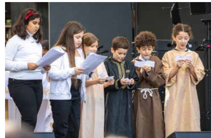
Under predikan framförde en barnteatergrupp från S:t Assias syriansk katolska kyrka i Södertälje en dramatisering av den helige Franciskus liv.

Franciskusdagen firas vartannat år på hösten i anslutning till helige Franciskus dag (som firas 4 oktober). KPN organiserar denna dag i samarbete med Studieförbundet Bilda och med stöd av Bonifatiuswerk. Om två år är det dags igen!