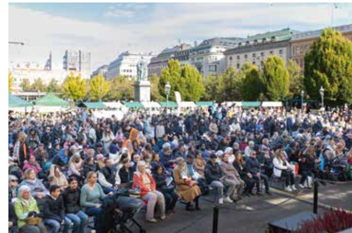
Runt 1000 personer hade samlats i Kungsträdgården i Stockholm.