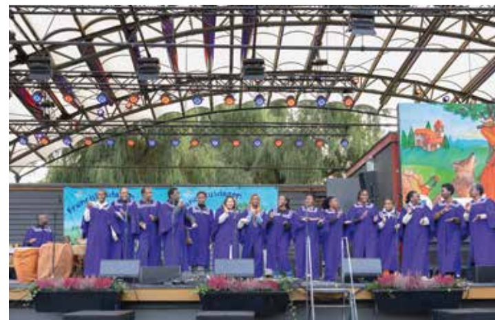
En ugandisk kör från S:ta Eugenia bidrog till programmet efter mässan.

Den 5 oktober 2024 samlades runt 1000 personer i Kungsträdgården i Stockholm för att fira Franciskusdagen. Det blev en riktig familjefest som inleddes med procession med den helige Franciskus staty. Därefter firades en utomhusmessa med kardinal Anders Arborelius som avslutades med en välsignelse av husdjur. Såväl katoliker från flera olika håll i landet (bland annat Västerås, Jönköping, Örebro, Södertälje och Storstockholm) som kristna från andra samfund hade samlats.