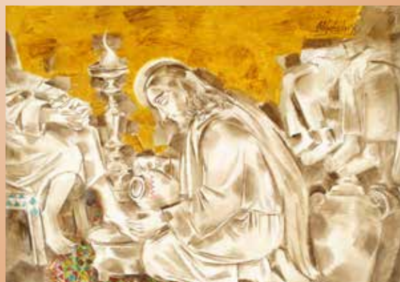
Jesus tvättar Petrus fötter.