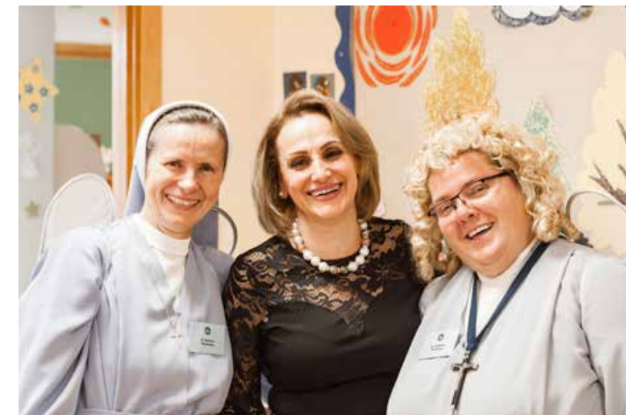
Engagerade kateketer har förvandlats till änglar på Kateketens dag i Södertälje, hösten 2018.

Verksamheten kan bedrivas i studiecirkel, på folkhögskolor, distanskurser (t ex genom Zoom), kulturarrangemang eller så kallad