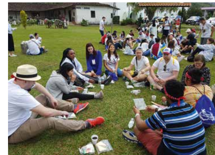
Ungdomar ur den svenska gruppen under Världsunngdomsdagarna i Panama, januari 2019. Foto: © Stiftsunngdomspräst br. Witold Mlotkowski OFM.

Mer specifika kvaliteter hos en medvandrare är någon som är balanserad och inlyssnande, en person som hämtar styrka i bönen och som känner sina egna begränsningar och svagheter. På så vis kan medvandrarerna undvika fördömande eller medhårsstrykande attityder och istället vara det stöd den unga behöver. Medvandrarerna ska också visa respekt för personens frihet och de val han eller hon gör och undvika osunda bindningar (jfr dokumentets punkt 102).