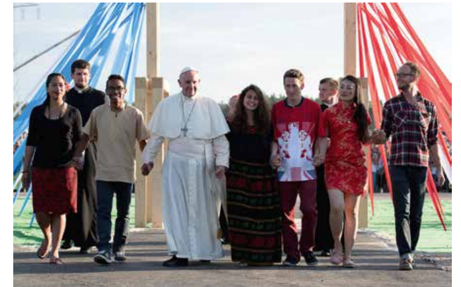
"Idag kallar Jesus oss, han som är vägen, sanningen och livet." Påven under Världsunngdomsdagarna i Krakow, 2016.

För att utveckla dessa personliga kvaliteter och reflekterande förhållningssätt ska kyrkan erbjuda utbildning och kontinuerligt stöd åt medvandrarerna. Någon som ger mycket åt andra behöver själv trygga strukturer omkring sig som ger omsorg och vägledning. Att slå följe med unga är ett viktigt uppdrag som kräver förberedelse, vishet och ett större kyrkligt nätverk som kan bekräfta och stärka medvandrarerna i sin kallelse att hjälpa de unga att lyssna till Guds röst och följa den. Ett av förslagen som framträder i dokumentet är gemensamma utbildningar för personer med olika funktioner inom kyrkan, som präster, ordensfolk och lekpersoner med kyrkliga uppdrag.