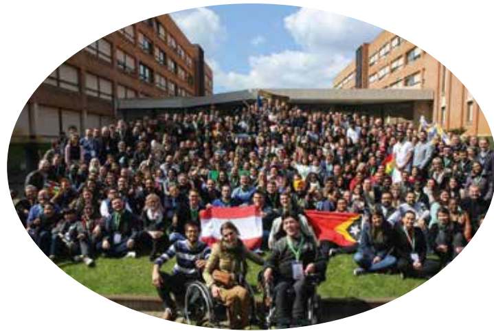
Ungdomar samlade under försynoden till ungdomssynoden i Rom, oktober 2018. Foto © Dikasteriet för lekmanen, familjen och livet.

Ungdomsfrågor är just nu centrala frågor för katolska kyrkan, inte bara med anledning av den världsvida övergreppskultur som sedan i somras blivit smärtsamt uppenbar, utan också med tanke på Världsunngdomsdagen som i januari firades i Panama som en global trosmanifestation för unga och inte minst höstens biskopssynod som hade temat "Unga, tron och att urskilja kallelser". Hur kan denna synods reflektion vara relevant för oss i Stockholms katolska stift, och vad säger den om kateketens roll för unga som vill växa i tron och upptäcka sina kallelser?