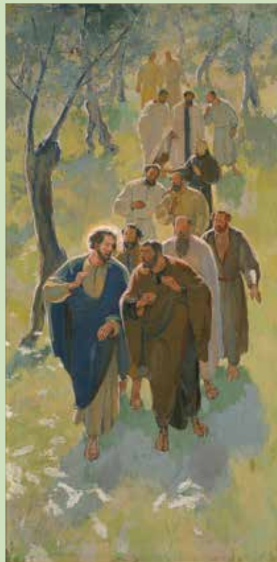
Jesus lyssnar på sina lärjungar. "Vandringen genom Galiléen" av Olle Hjortzberg.